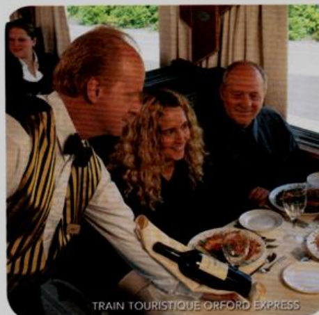
TRAIN TOURISTIQUE ORFORD EXPRESS

Envie d'une balade qui sort de l'ordinaire? Montez à bord de l'une des trois voitures-restaurants du train touristique Orford Express pour une aventure hors du commun. Pendant que vous observerez les paysages époustouffants défiler sous vos yeux, vos papilles pourront se réjouir devant un copieux brunch, un dîner gourmand ou un souper digne des grandes tables. La randonnée, d'une durée de 3 h 30, débute à la gare de Sherbrooke et se dirige vers Magog, puis Eastman, avant de revenir à son point de départ. Un arrêt panoramique est également prévu à la pointe Merry du lac Memphrémagog. Le train circule du mercredi au dimanche, jusqu'en décembre, et peut accueillir jusqu'à