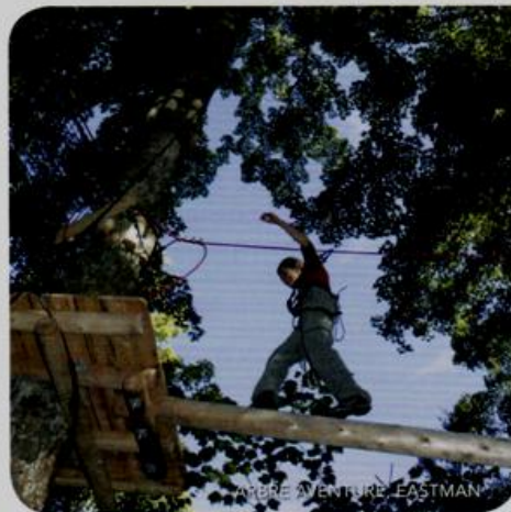
ARBRE AVENTURE EASTMAN