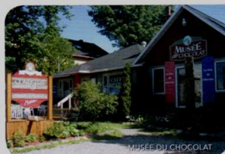
MUSEE DU CHOCOLAT